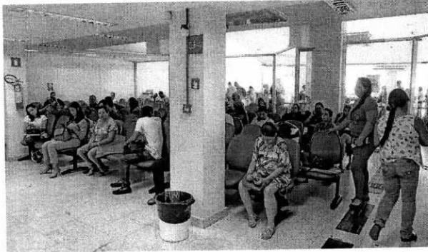
Fila de pessoas para atendimento na agência do INSS; por falta de funcionários, a situação foi agravada

O INSS afirma, por meio de nota enviada pela assessoria de imprensa, que houve um acúmulo de requerimentos "em especial em 2018 e nos primeiros meses de 2019". Segundo o órgão, houve